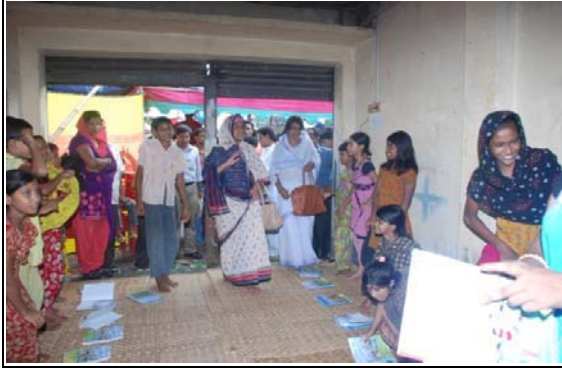
উপানুষ্ঠানিক শিক্ষা কেন্দ্র পরিদর্শন