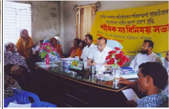
স্থানীয় সরকার প্রতিষ্ঠানের সাথে মত বিনিময় সভা