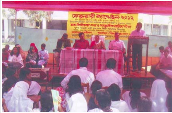
মৌন হায়রানী বন্ধ উপলক্ষে সমাবেশ