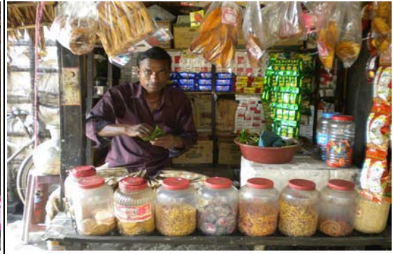
আয় বৃদ্ধিমূলক কার্যক্রম (IGA)