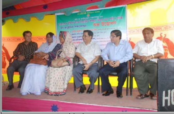
উপানুষ্ঠানিক শিক্ষা কেন্দ্র উদ্বোধন