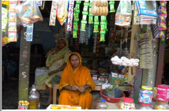
আয় বৃদ্ধিমূলক কার্যক্রম (IGA)