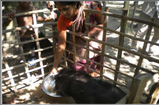
আয় বৃদ্ধিমূলক কার্যক্রম (IGA)