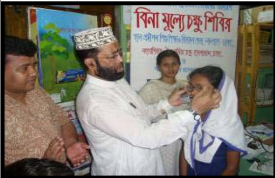
Free Eye Camp for Working Children