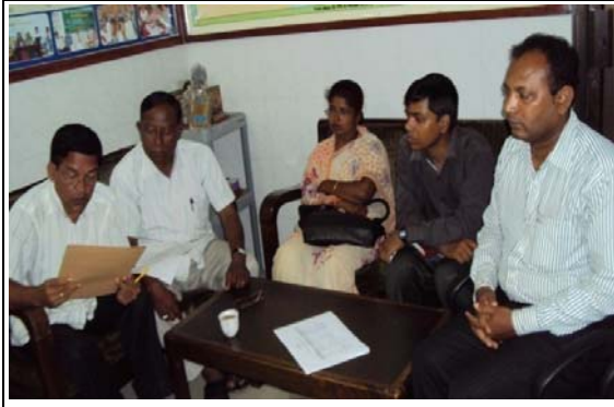
সহযোগী সংস্থাদের সাথে সমন্বয় সভা