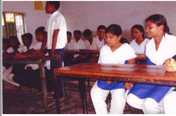
শিক্ষার্থী শেখসেসবকদের সাথে দ্বিমাসিক সভা