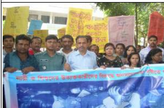
Rally against Eve teasing