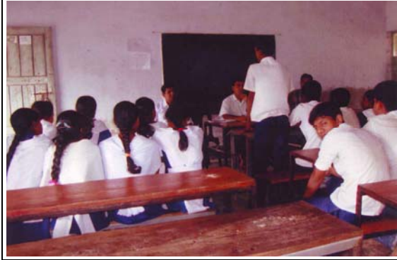
এসভিএসদের সাথে দ্বিমাসিক সভা