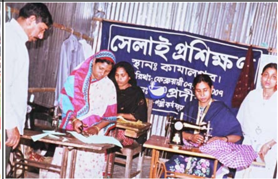
আয়বৃদ্ধিমূলক কার্যক্রমের দক্ষতা উন্নয়ন প্রশিক্ষণ