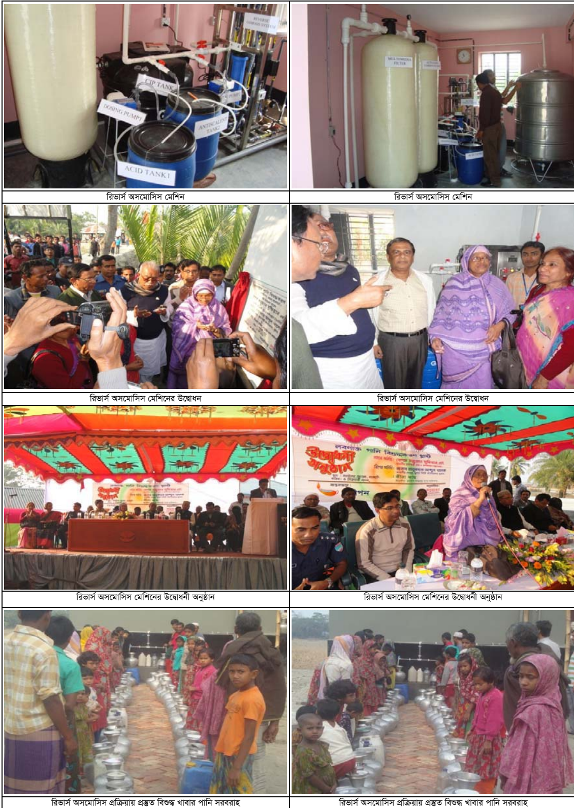
রিভার্স অসমোসিস মেশিন