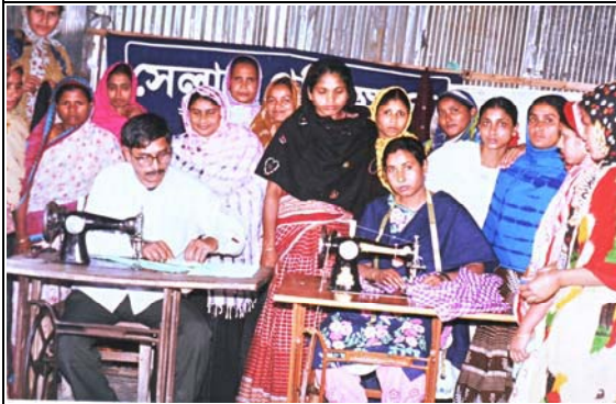
আয়বৃদ্ধিমূলক কার্যক্রমের দক্ষতা উন্নয়ন প্রশিক্ষণ