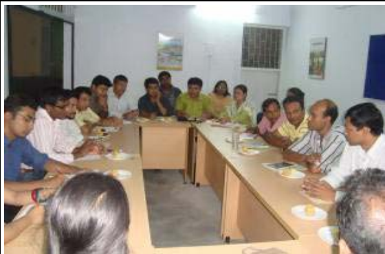
Meeting with NGO networks