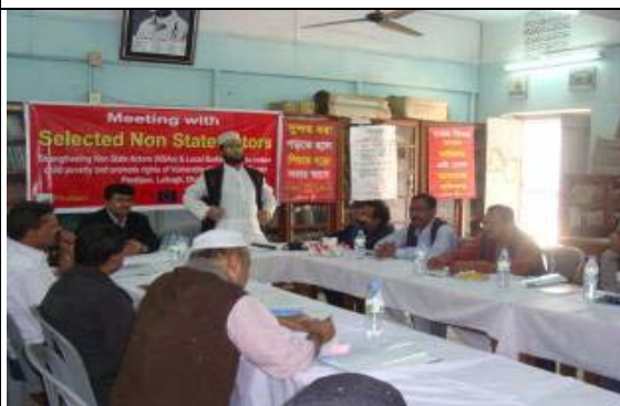
Meeting with Selected NSAs