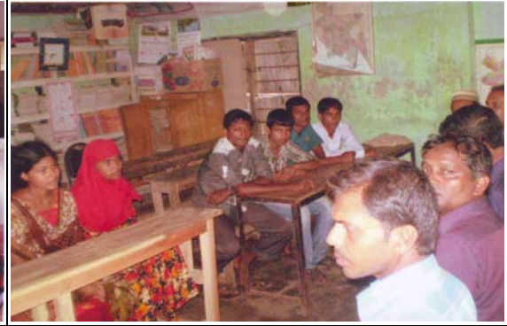
এসভিএসদের সাথে দ্বিমাসিক সভা