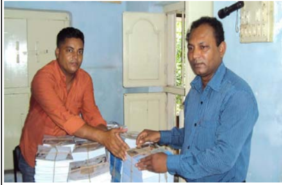
শিক্ষার্থীদের দেয়ার জন্য শিক্ষকদের নিকট বই হস্তান্তর