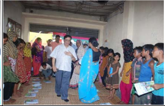
উপানুষ্ঠানিক শিক্ষা কেন্দ্র পরিদর্শন