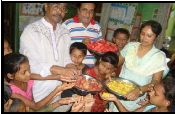
Fruits festival at LRC