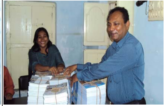
শিক্ষার্থীদের দেয়ার জন্য শিক্ষকদের নিকট বই হস্তান্তর