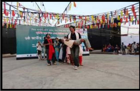
6th International Theater Festival