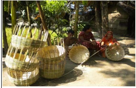
আয় বৃদ্ধিমূলক কার্যক্রম (IGA)