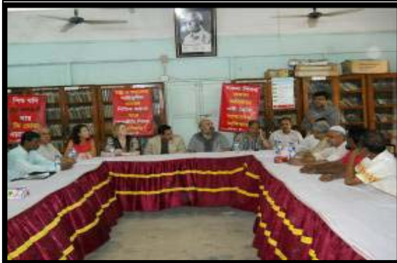
British All Party Parliament Members