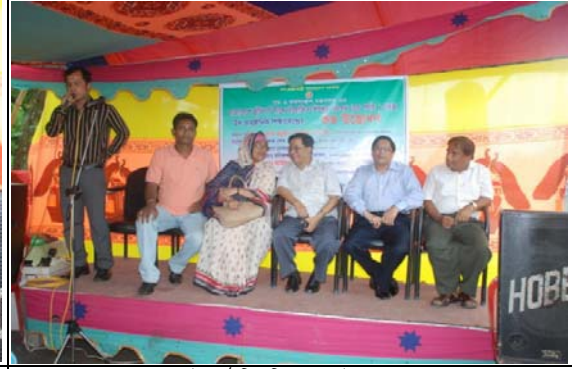
উপানুষ্ঠানিক শিক্ষা কেন্দ্র উদ্বোধন