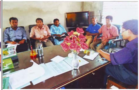
এনএনপিসি টিমের সাথে মতবিনিময় সভা