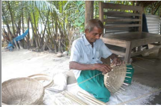
আয় বৃদ্ধিমূলক কার্যক্রম (IGA)