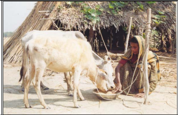
আয় বৃদ্ধিমূলক কার্যক্রম (IGA)